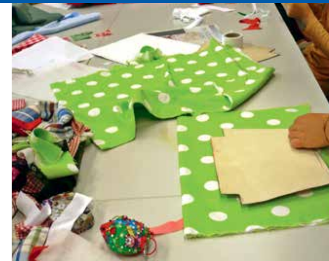
Bühnenbild / Textilgestaltung - mit Susanne Bäuerle Kurs Nr.: X 9400

Ihr näht unter Anleitung Wandbehänge aus Stoff, welche die Bühne eindrucksvoll verschönern werden. Diese dürft ihr nach den Aufführungen mit nach Hause nehmen. Ihr näht von Hand und mit der Maschine und bemalt/bedruckt unsere Stoffe. Außerdem seid ihr auch noch für die Requisiten zuständig. Das heißt, ihr müsst eventuell noch andere Dinge basteln, nähen, malen – wie z.B. Blumen – je nachdem, was die Darsteller*innen und Sänger*innen noch so für ihre Auftritte brauchen.