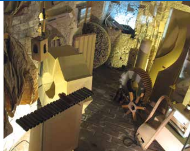
Kartonorchester und Bühnenbild - mit Volker Illi Kurs Nr.: X 9400 A

Ihr baut ein Kartonorchester mit Rahmentrommeln und kleinen Klangerzeugern, die das Bühnengeschehen ergänzen und für Effekte sorgen.